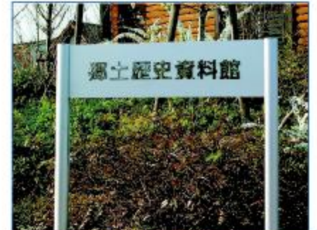
Montants Module Plus de Ø 60 mm avec 1 panneau standard de 250 mm.