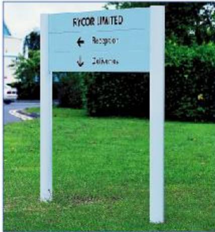
Montants Module Plus de Ø 90 mm avec 3 caissons standards de 150 mm.