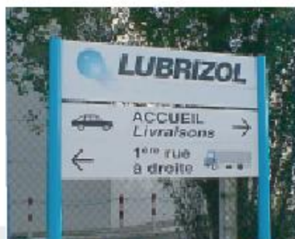
Montants Module Plus de Ø 90 mm avec 2 caissons.

Autres teintes ou traitements de surface, nous consulter.