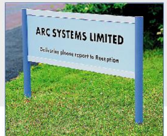
Montants Module Plus de Ø 60 mm avec 1 panneau semi-fini en PVC.