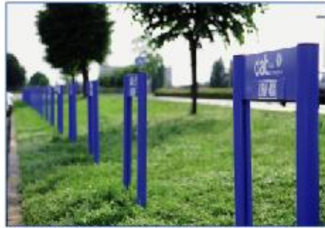
Montants Module Plus octogonal de 80 mm avec 1 caisson.