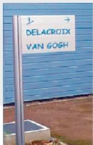
Montants Module Plus en drapeau de 80 mm avec 3 caissons.