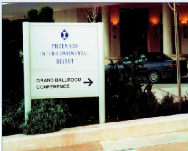
Montants Module Plus de Ø 90 mm avec 2 panneaux semi-fini en PVC.