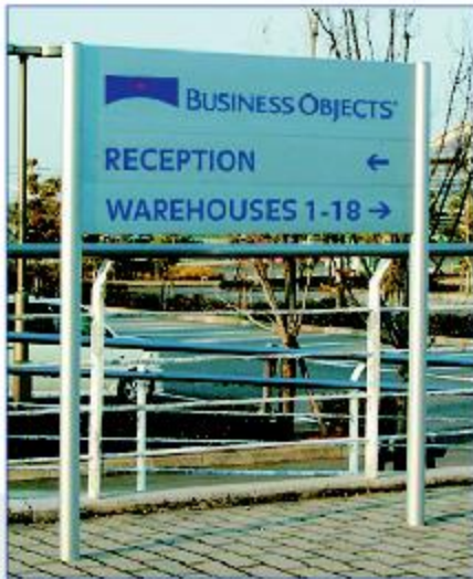
Montants Module Plus de Ø 90 mm avec 3 caissons standards, 2 de 150 mm et 1 de 250 mm.

Module Plus est un concept complet de bi-mâts ou d'enseignes directionnelles. Il est modulaire ainsi qu'interchangeable. Extrêmement robuste pour le long terme et très simple d'emploi.