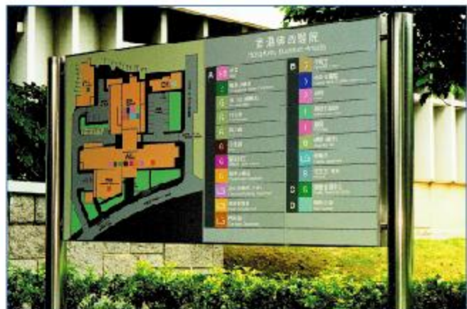
Montants Module Plus de Ø 90 (traitement de surface Inoxy) avec ensemble de caissons standards aluminium et semi-finis en PVC.

Unité d'éclairage en plongée pour lampes fluorescentes