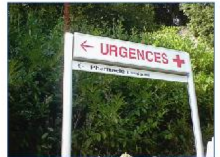
Montants Module Plus de Ø 90 mm avec 1 caisson standard et 1 caisson lumineux.