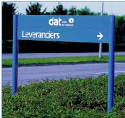
Montants Module Plus de Ø 60 mm avec 3 caissons standards de 250 mm.