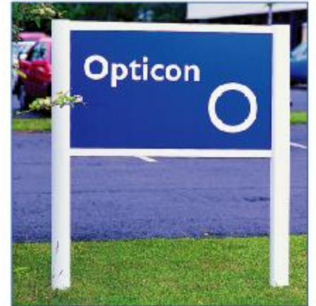
Montants Module Plus octogonal de 80 mm avec 1 panneau semi-fini en PVC.